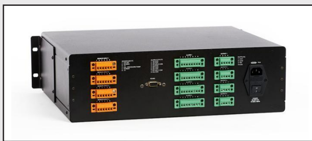
后面板输入/输出连接

MCU主机还可以通过与 Liquidew I.S. 液相微水分析仪或 Minox-i 氧变送器*相组合，提供液体中微水分析或氧测量功能。