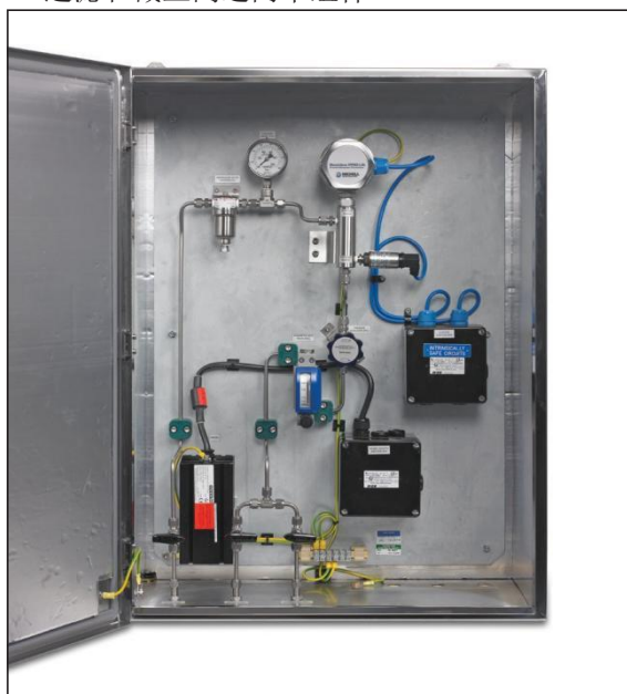
Promet I.S. 取样系统